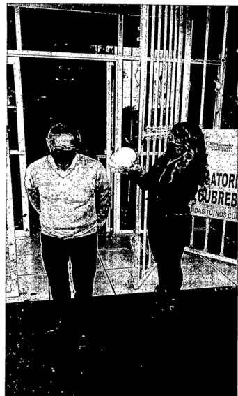
REVISION AL PERSONAL DEL SISTEMA MUNICIPAL DIF, EN LA HORA DE ENTRADA DEL DIA 02 DE AGOSTO 2021.